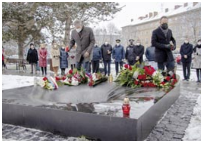
Foto: Uctění památky obětí střelby.