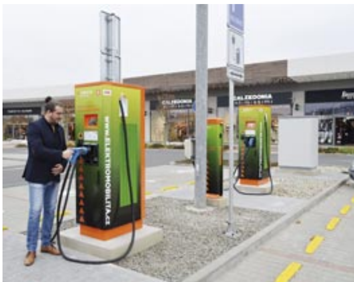
Nabíjecí stanice elektromobilů.

„Je jasné, že boom elektromobility je tady a výstavba veřejných stanic je zcela nutná pro další rozvoj aktivit v této oblasti. Nákupní centra jsou vhodnými lokalitami, kde budování