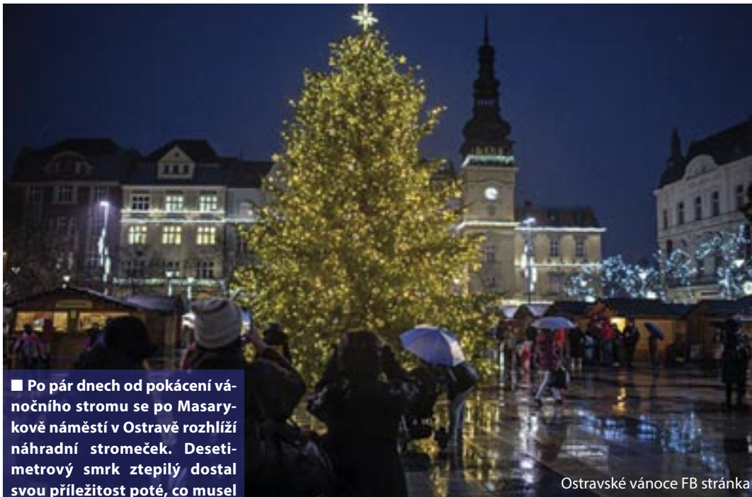
Ostravské vánoce FB stránka

■ Po pár dnech od pokácení vánočního stromu se po Masarykově náměstí v Ostravě rozhlíží náhradní stromeček. Desetimetrový smrk ztepilý dostal svou příležitost poté, co musel být původní strom z důvodu dvoumetrové praskliny ve svém kmeni z bezpečnostních důvodů bezodkladně skácen.