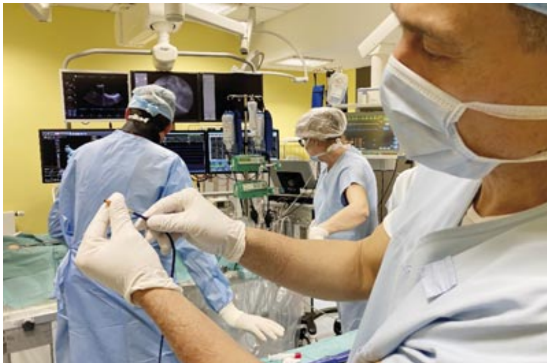
Centrum kardiiovaskulární péče v Brně.

Zdroje a mechanismy arytmíí jsou v zásadě dvojí, buď špatné elektrické impulzy vznikají v ohraňčeném ložisku, nebo dochází k rotaci elektrického impulzu v části